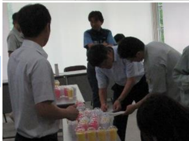
2018年度のセミナーの様子