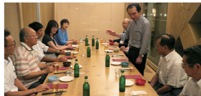
視察先の鶴岡市での交流会の様子 (令和元年)