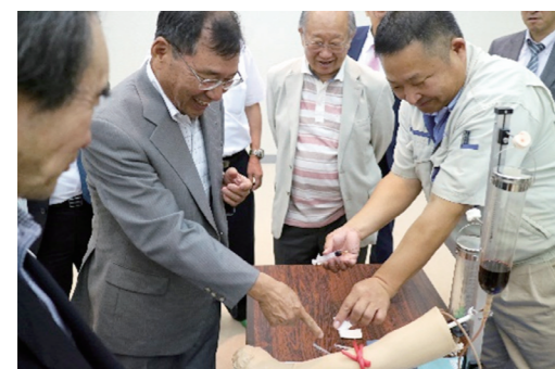
医療機器事業等を手掛ける(株)高研 (山形県鶴岡工場) にて教育用医療モデルを体験する参加者 (令和元年)

商品 / 技術 / 研究開発、新産業創出・経営革新のヒントを模索するため、毎年県内外の企業視察会を実施しています。